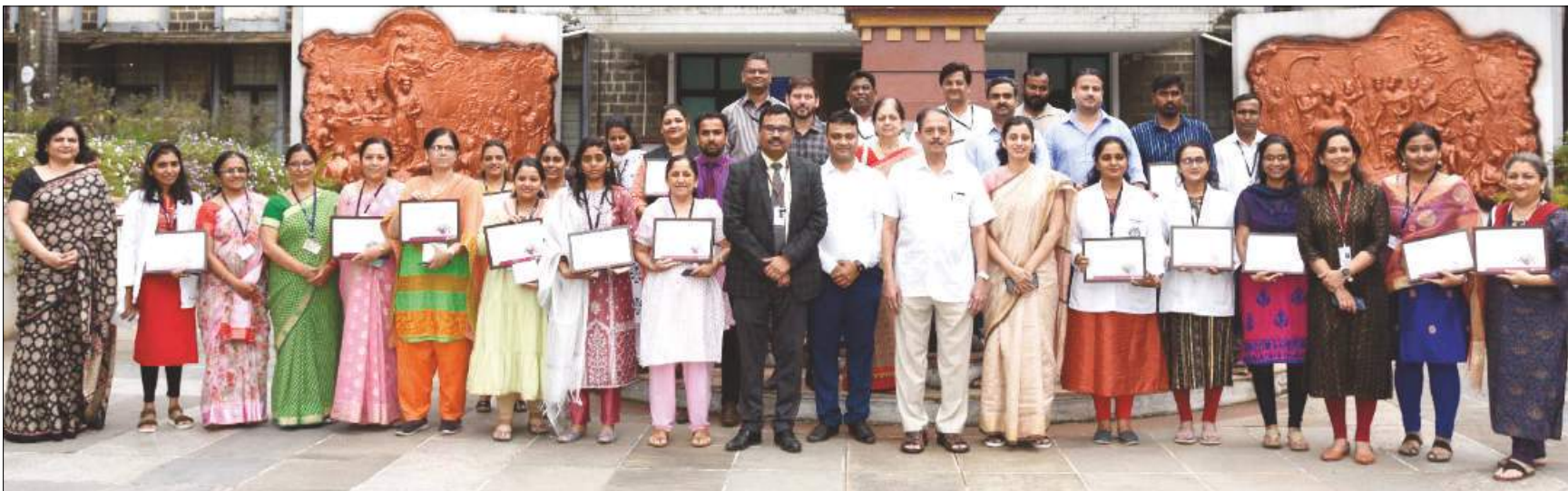
Axis bank felicitated teachers of Tilak Maharashtra Vidyapeeth on occasion of Teachers day to appreciate his/her quality work and motivate them to do better every day.